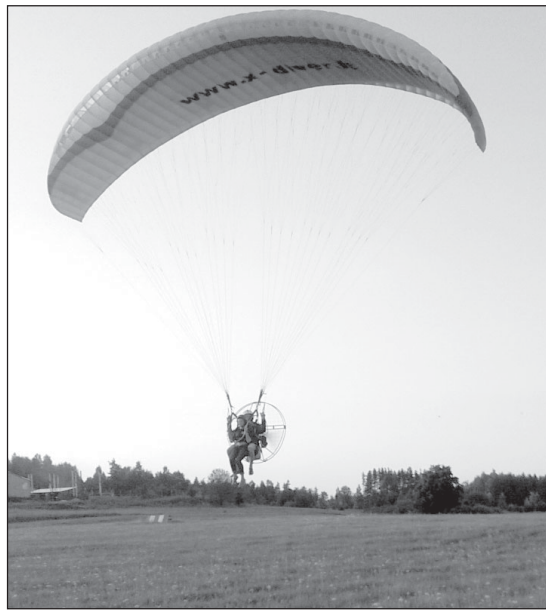
Grakščiai sklendžia parasparnis.

Už lango dar šalta, niūru ir blanku. Pilka ir padangė, tik kartais joje „sparnus“ išskleidžia margaspalviai parasparniai.